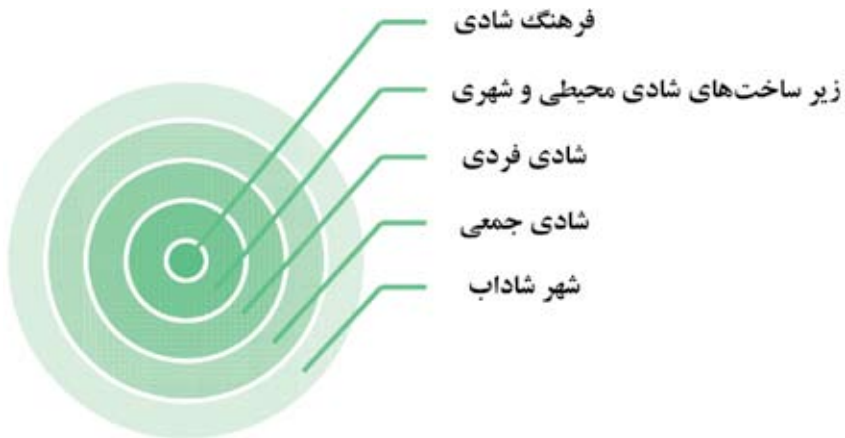
شکل شماره (۱): ارتباط بین شادی فردی، شادی جمعی و شهر شاداب (محقق ساخته)

در پاسخ باید اذعان نمود که لازم است شادی فردی و سطح نسبی از شادی در افراد جامعه وجود داشته باشد، چرا که در غیر این صورت حتی اگر بهترین امکانات شهری، مراکز تفریحی، مراکز خرید، مراکز فرهنگی، مبلمان، پیاده‌روها، باغ‌ها، پارک، سینما و... فراهم شوند، همچنان شهروندان آن شهر احساس شادابی نخواهند کرد. شاید مسئولین شهری بتوانند با ایجاد مراکز تفریحی، مراکز بهداشتی، موزه، بهبود حمل و نقل ریلی و... بتوانند محیط و شهر شادابی را ایجاد نمایند، اما این گونه نمی‌توانند شادابی شهروندان را بخرند. بنابراین بخشی از شادابی شهر، به شادابی افراد آن شهر بر می‌گردد. شکل شماره (۱) تعامل و ارتباط بین شادی فردی، شادی جمعی، و شهر شاداب را نشان می‌دهد.